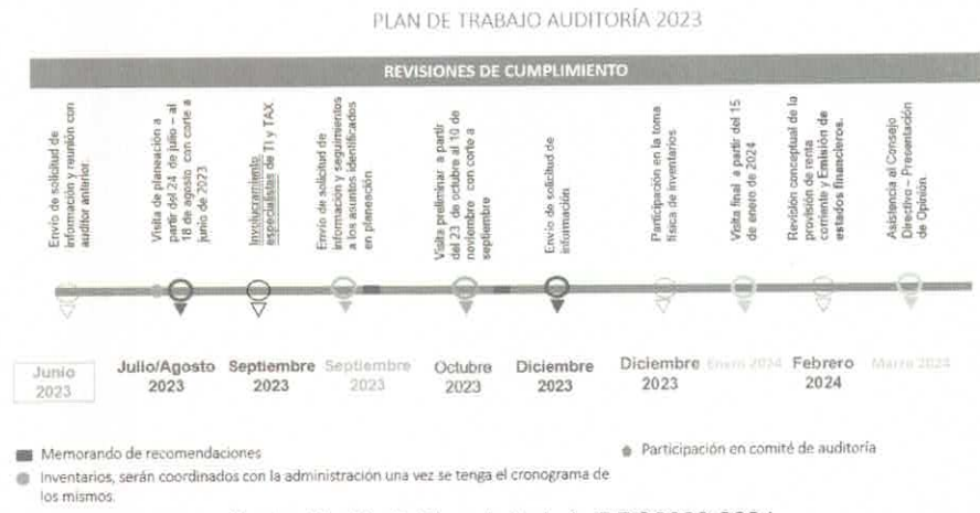
Ilustración No.6. Plan de trabajo DBO2023-2024

Expone, el plan de trabajo, donde relaciona las actividades, cronograma, compromisos, fechas, que adelantará en la Corporación, previa reuniones de trabajo con las partes relacionadas.