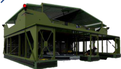
1 PLATAFORMA AVANZADA DE GUARDACOSTAS