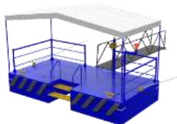
4 EMBARCADEROS FLUVIALES TIPO A