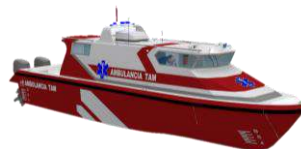
2 LANCHAS T.A.M.