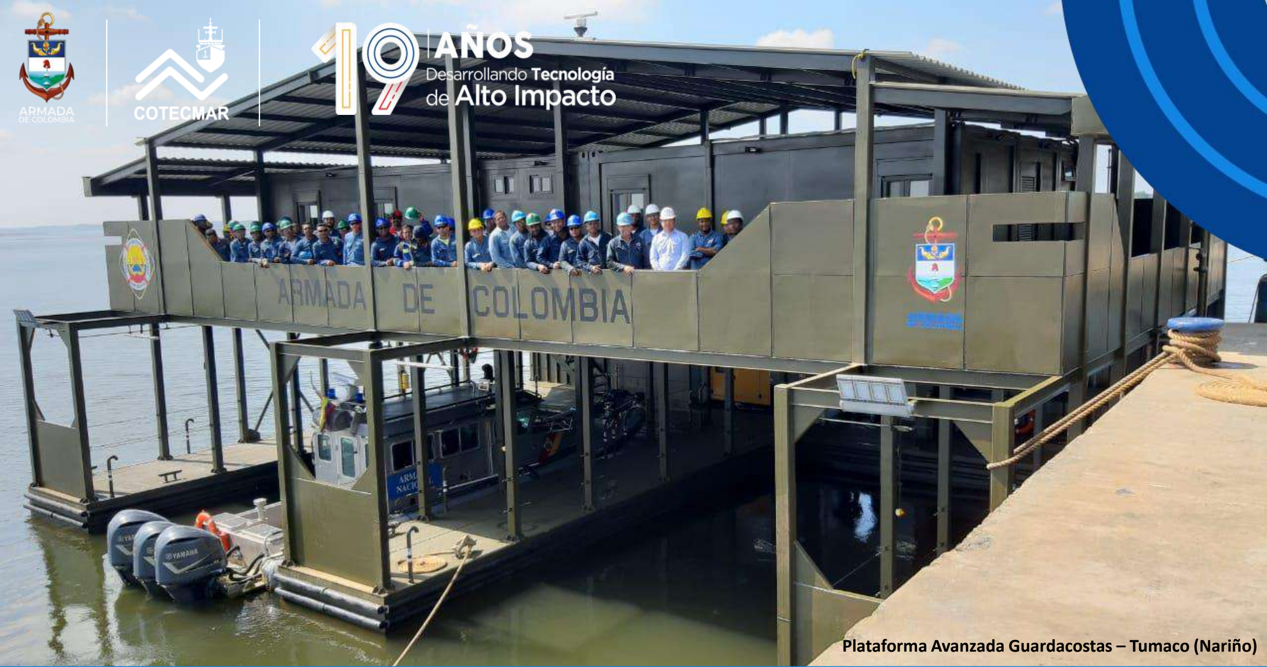
Plataforma Avanzada Guardacostas – Tumaco (Nariño)

19 AÑOS Desarrollando Tecnología de Alto Impacto