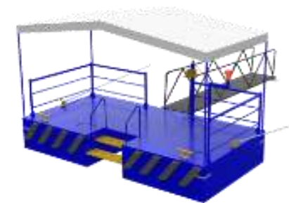
13 EMBARCADEROS FLUVIALES TIPO A