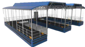
1 EMBARCADERO FLUVIAL TIPO E