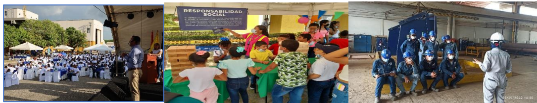
Ilustración 2. Campaña socialización y sensibilización sobre los valores corporativos

A través de oficio No.1277-GETHU del 28 de septiembre de 2022, se promovió el nombramiento de los Promotores de Ética a nivel gerencial, del Comité de Convivencia Laboral y COPASS teniendo en cuenta la responsabilidad adquirida en cada uno de los roles que desempeñan al interior de la Corporación.