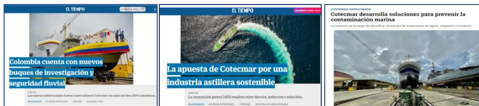
Ilustración 9. Divulgación actividades de difusión y comunicación