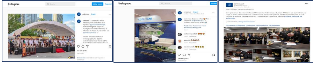
Ilustración 8. Enlaces seguidores redes sociales