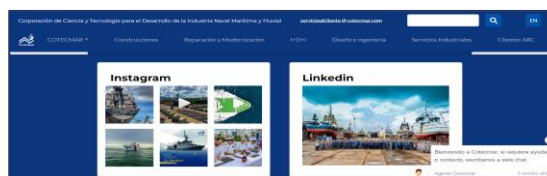
Ilustración 13. Pantallazo página web COTECMAR

Una de las responsabilidades del área Coordinación Comercial, es la de mantener la información actualizada en la página web y canales de acceso a requerimientos en funcionamiento.