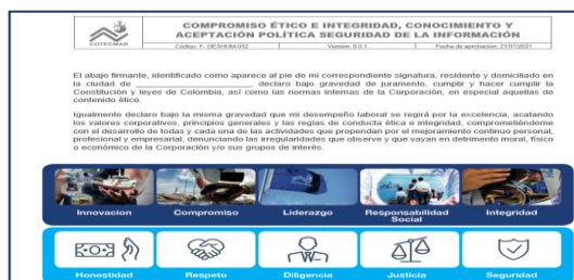
Ilustración 5. Pantallazo Formato F-GESHUM-052

Se socializó a nivel corporativo el formato F-GESHUM-052 “Compromiso ético e integridad, conocimiento y aceptación política seguridad de la información”. Se recalca que el mismo, es firmado por todo el personal que ingresa a laborar con la Corporación y reposa en su hoja de vida.